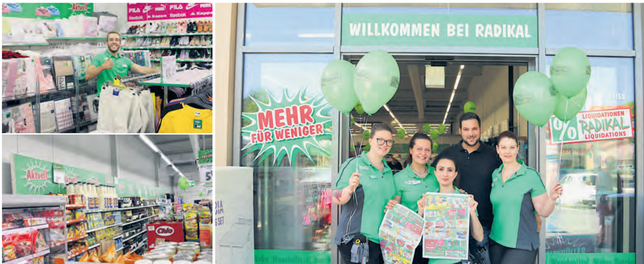
Das umfangreiche Sortiment.