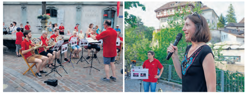
Hörner vor dem Redinghaus.