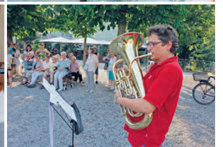
Spiel auf dem Euphonium.